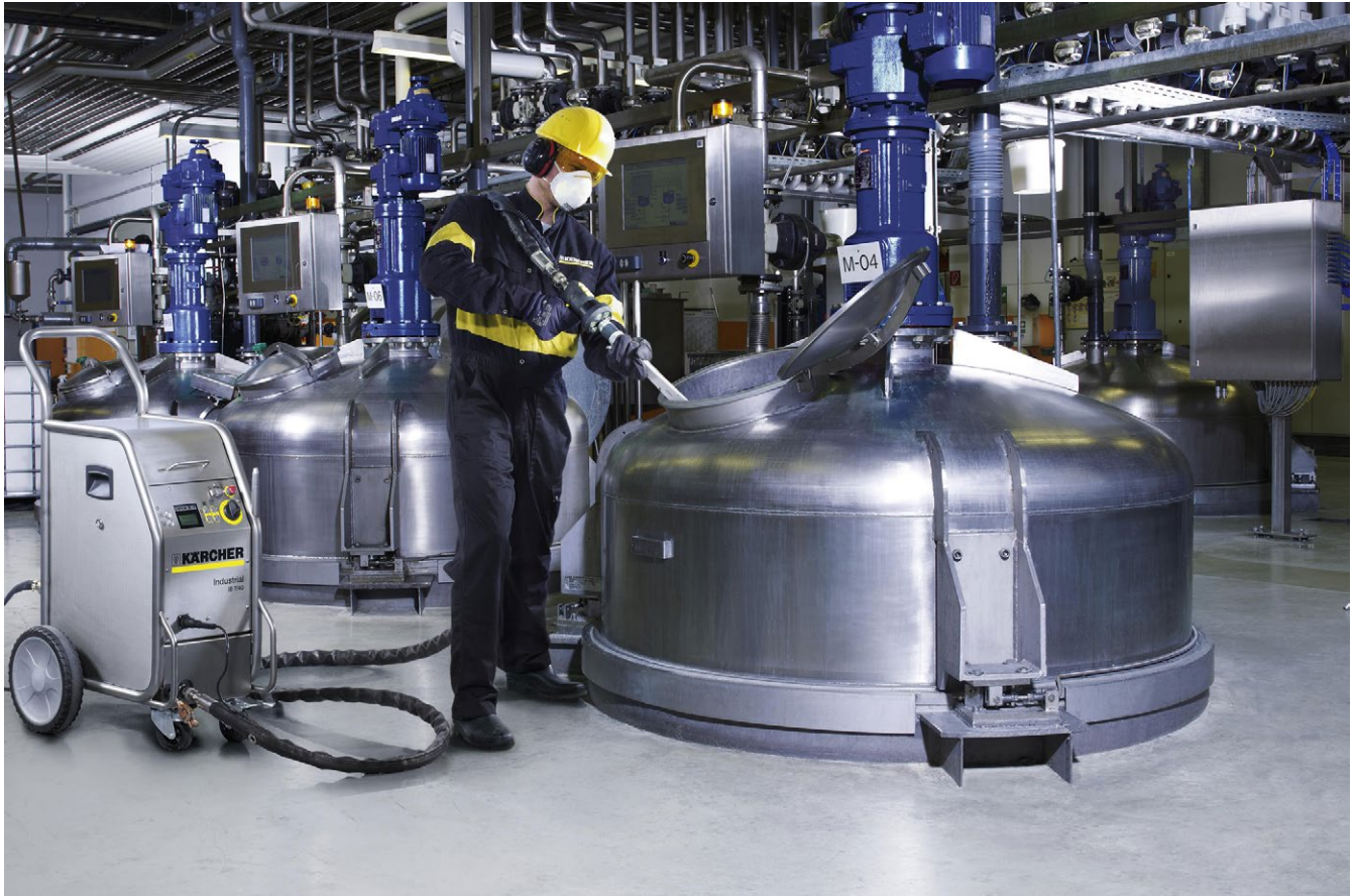
IB 7/40 Adv