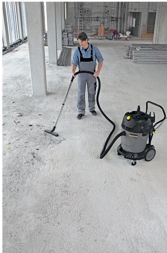
NT 65/2 Tact²